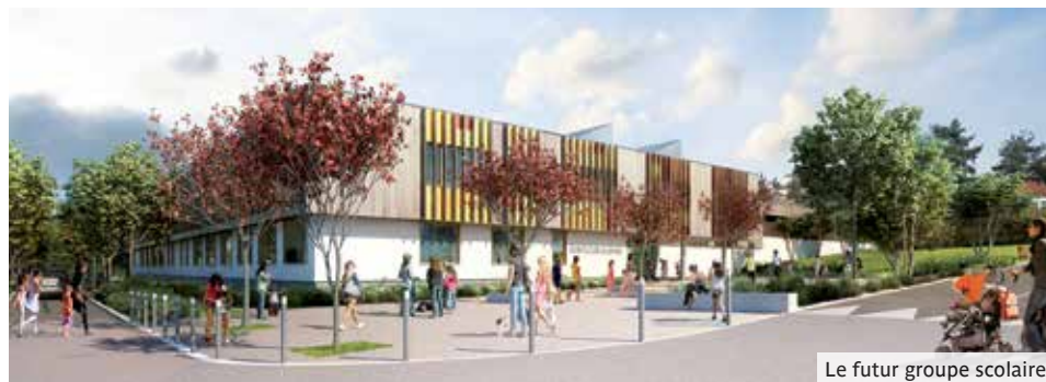
Le futur groupe scolaire