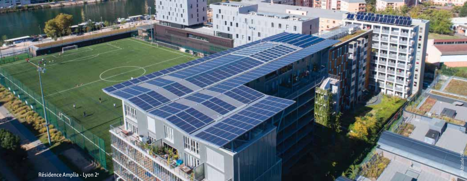
Résidence Amplia - Lyon 2 e