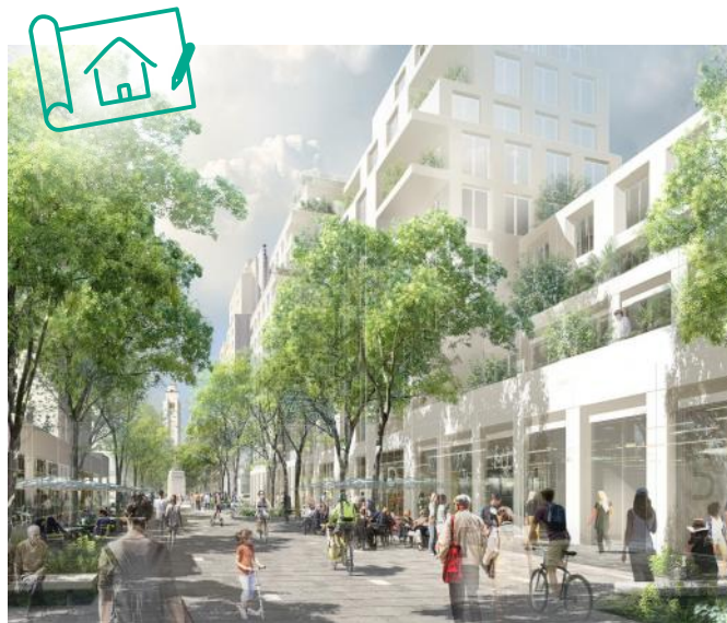
▲ L'avenue Henri-Barbusse prolongée

DEUX DES PRINCIPAUX AXES DU QUARTIER, L'AVENUE HENRI-BARBUSSE ET L'ESPLANADE AGNÈS-VARDA, SERONT ENTIÈREMENT PIÉTONS.