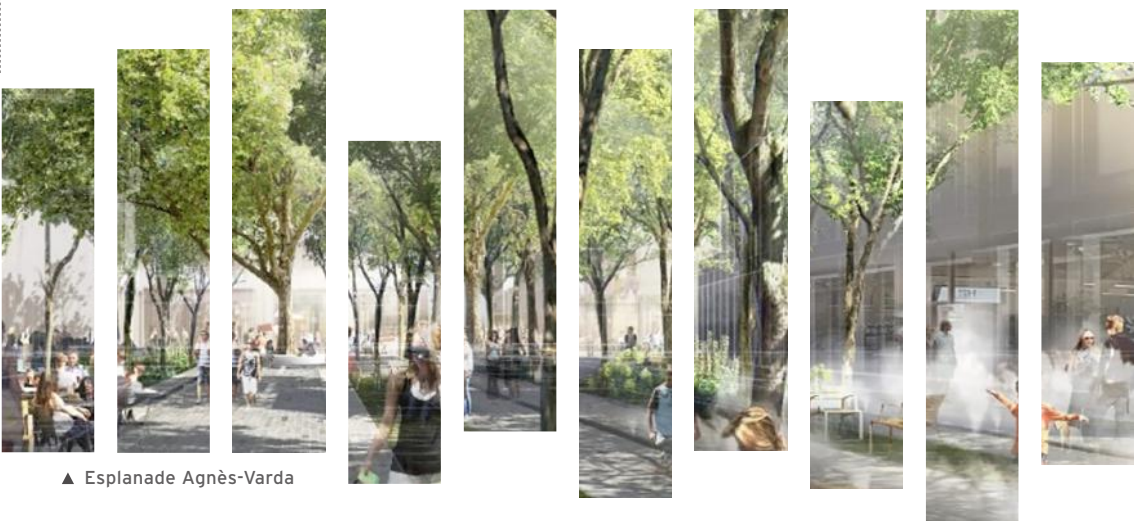
▲ Esplanade Agnès-Varda