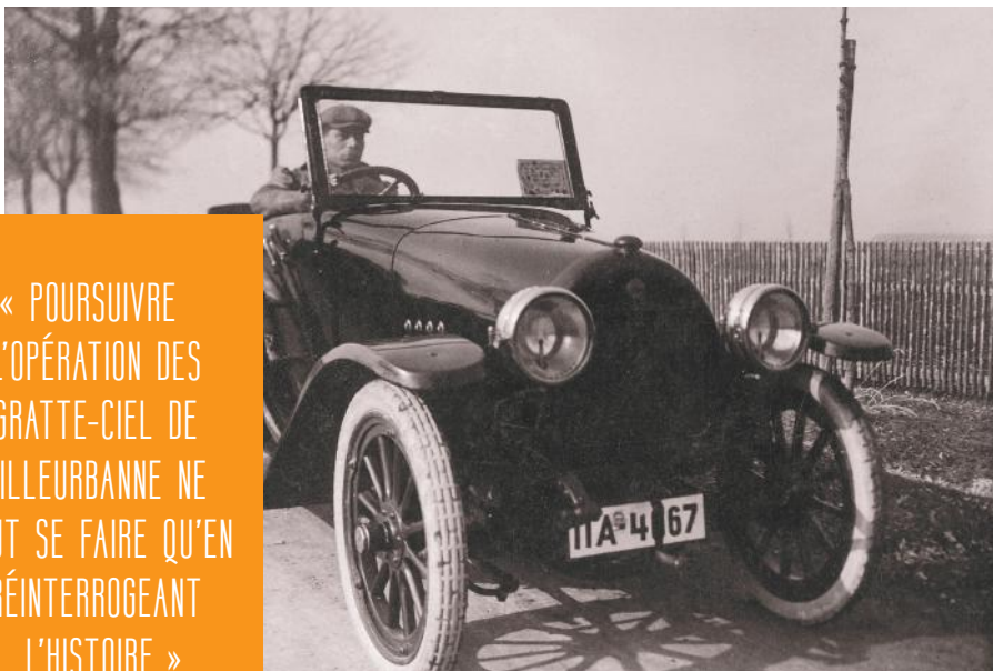
▲ Peugeot type 163

La nouvelle histoire qui s'écrit pour Gratte-Ciel centre-ville prend ses racines dans le quartier historique.